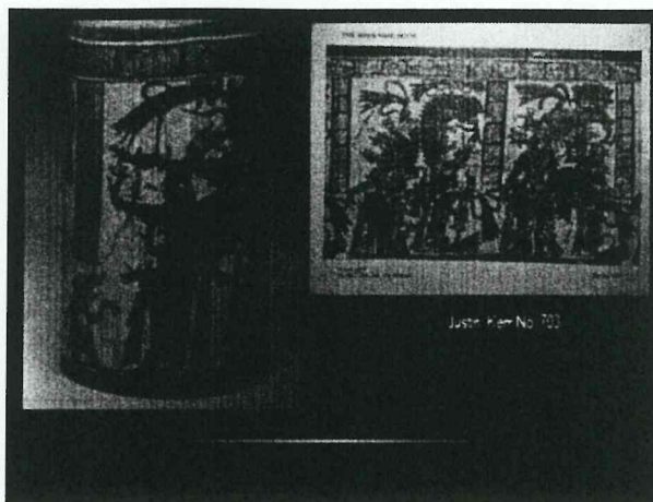
Vasos parecidos al Vaso de Hormigas Blancas ,Naranjo en colecciones privadas